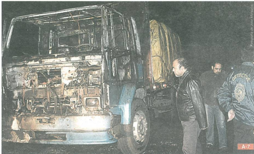
Seis encapuchados armados quemaron un camión en la Ruta 5 Sur, a la altura de Pailahueque, Ercilla, cerca de las 22.30 horas de anoche. Los sujetos encañonaron al conductor, quien resultó ileso. Fueron hallados mensajes alusivos a la muerte del estudiante Matías Catrileo.

protagonistas de las informaciones, un 10% son imágenes de encapuchados y un 5% de Matías Catrileo.