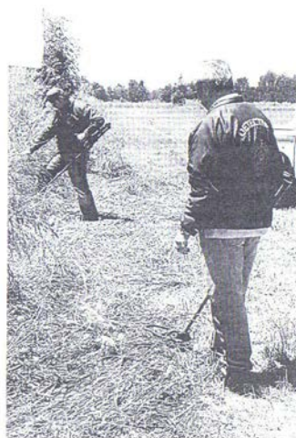
Más de 30 detectives premunidos de sofisticados equipos detectores de metales recorrieron durante todo el día de palmo a palmo el lugar donde se produjo el enfrentamiento en el fundo Santa Margarita.

Se observa foto portada de camión quemado, imágenes de encapuchados y detectives en fundo Santa Margarita.